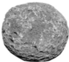
ظاهر بیرونی سخت و زمخت